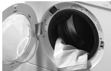
FIGURE / FIGURA 2