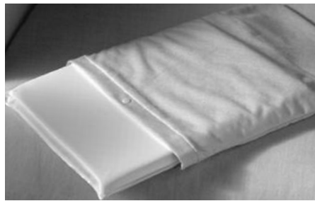
FIGURE / FIGURA 1