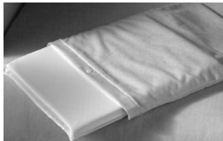
FIGURE / FIGURA 1